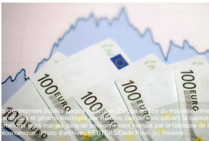
ts d'entreprises publiés jusqu'à présent en Europe au titre du troisième trimestre. Les analystes et gérants interrogés par Reuters, ces derniers saluant la capacité des sociétés à améliorer leurs marges dans un environnement marqué par la faiblesse de la croissance économique.

Vous recommandez ça. Inscription pour voir ce que vos amis